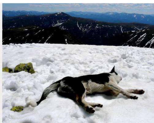
Хамар-Дабан – июнь, 2010. ЖАРКО-О-О-О...